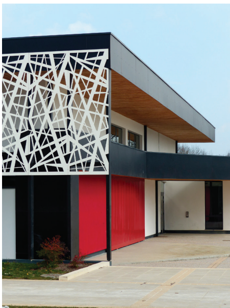
▲ Une architecture contemporaine aux lignes franches, que tempère une résille plus informelle