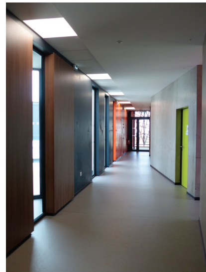
Circulation autour des « boîtes » indépendantes ▲