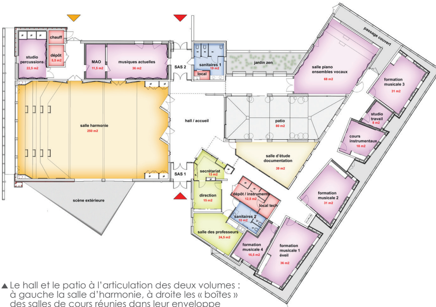
▲ Le hall et le patio à l'articulation des deux volumes : à gauche la salle d'harmonie, à droite les « boîtes » des salles de cours réunies dans leur enveloppe