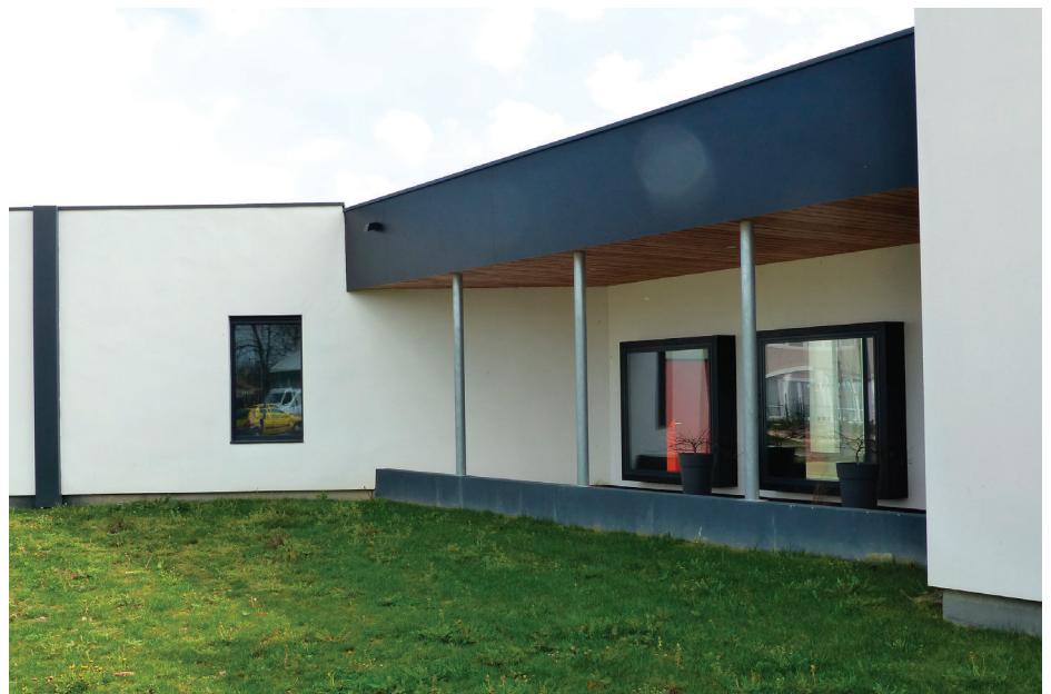
▲ Des lignes noires sur fond blanc comme évocation de la partition musicale