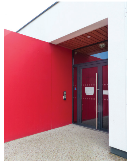
▲ Du noir et blanc, et le rouge réservé aux éléments signal