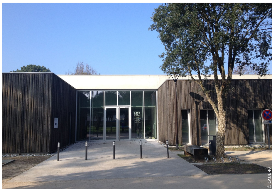
▲ Vue sur l'entrée