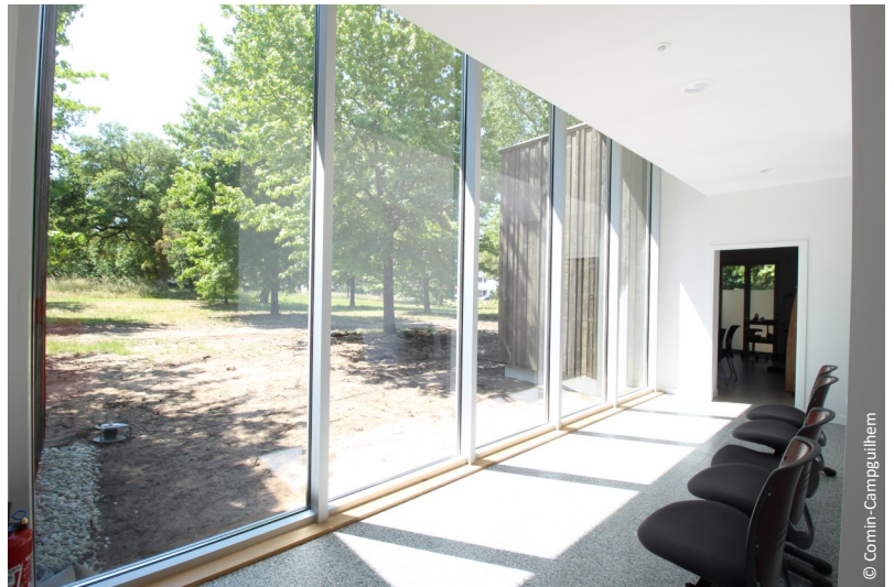
▲ Le paysage comme un tableau

Les professionnels de santé qui adhèrent au projet de santé sont une cinquantaine et sont regroupés dans une société interprofessionnelle de soins ambulatoires. C'est elle qui porte le pôle de santé et permet par l'ampleur de son projet de se doter d'équipements que l'on ne trouve que dans des centres hospitaliers : scanner et IRM. C'est aussi dans ce cadre que le pôle de santé de Mimizan a pu bénéficier de subventions.