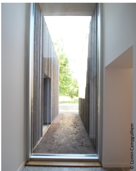
▲ Ouverture prolongeant la perspective visuelle

La Maison de santé regroupe un pôle médical et un pôle paramédical avec médecins, cabinets de consultations spécialisées, cabinets d'infirmier, salles d'urgence, kinésithérapeutes, podologues, diététicien, orthophoniste et psychologue.