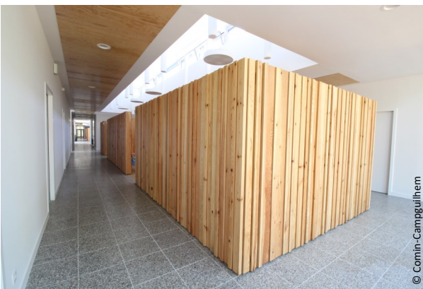
▲ Vue sur une circulation intérieure

La maison de santé accueille aussi le Service de Santé au Travail des Landes (médecine du travail). Depuis fin septembre, une gynécologue y a ouvert des consultations, à raison de 2 jours par semaine.