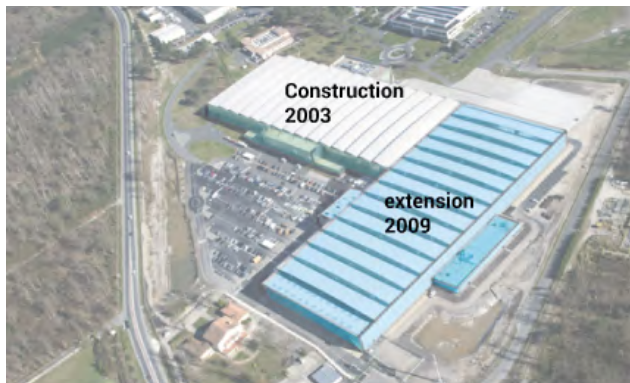
▲ Les différentes étapes de construction