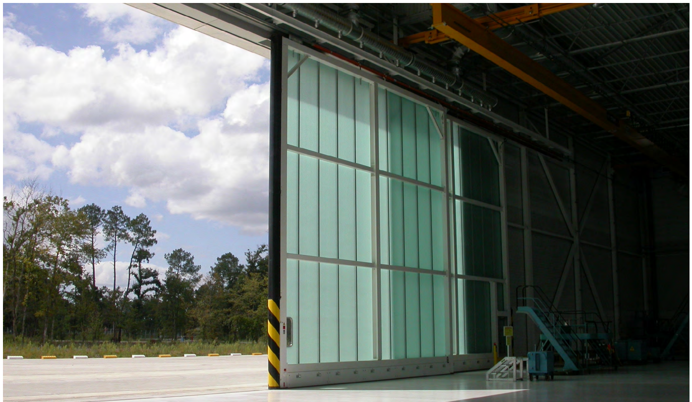
▲ Vue des portes coulissantes monumentales depuis l'intérieur de la Halle