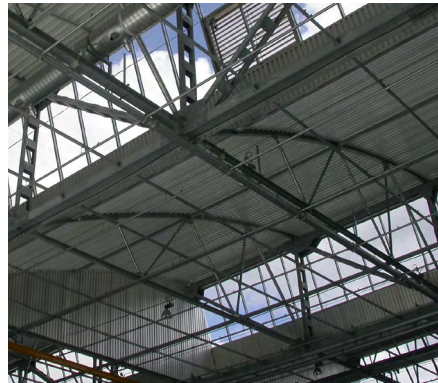
▲ Vue de la charpente métallique et des ouvertures en shed.