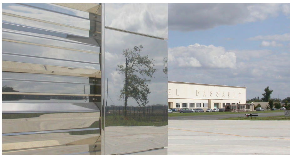
▲ Au premier plan : le bardage métallique de la nouvelle halle et au fond le bâtiment existant.