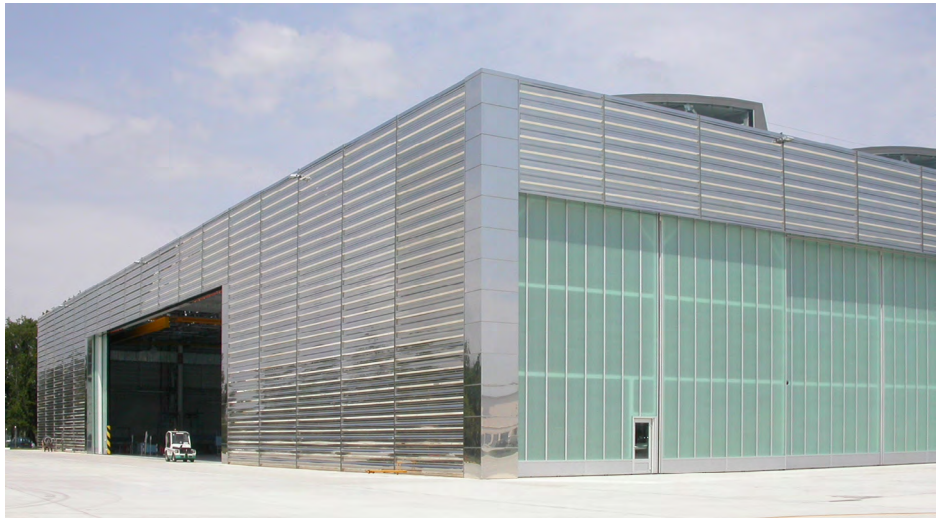
Vue générale du bâtiment ▶

Le site des architectes : http://lahat-architectes.com/