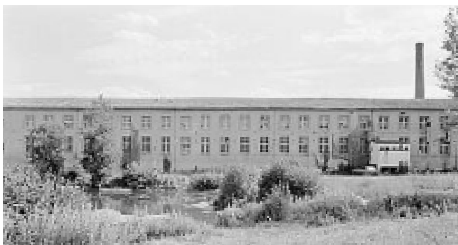
▲ Bâtiment de la filature des années 1920, l'atelier du tissage