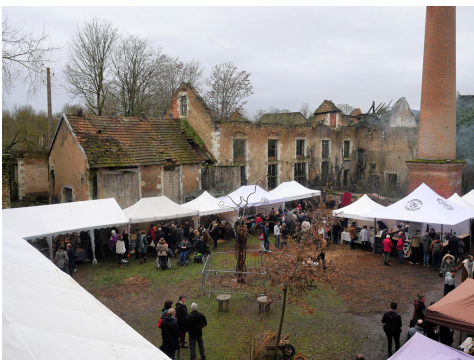
▲ Laboratoire d’expérimentation économique & social