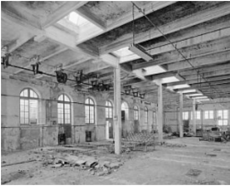
▲ Développement durable, patrimoine et tourisme