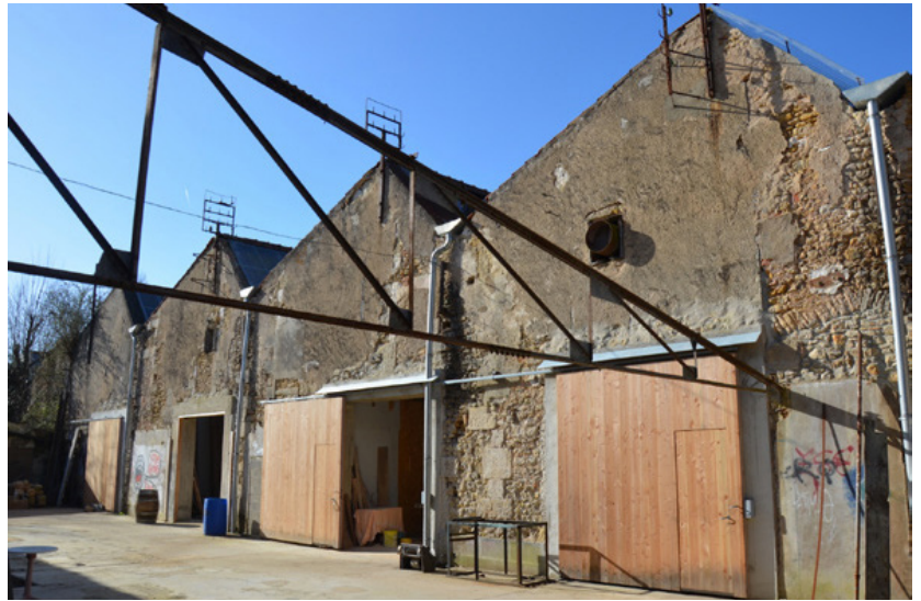
▲ Façade des ateliers d’artisans

L’ancienne filature est inscrite au titre des monument historique depuis 2012. Sur les 15 000m2 de bâti de l’ancienne friche industrielle, 2500m2 ont été rénovés et reconvertis en espaces de travail entre 2011 et 2017. La réhabilitation des espaces s’est faite en intégrant au maximum les techniques de l’éco-construction (ossature bois, isolation performante en matériaux naturels, matériaux de réemploi). Le parti pris architectural est basé sur le principe « des boîtes dans la boîte », où seuls des espaces ergonomiques sont rendus confortables car , selon les propriétaires, les grands plateaux auraient été peu adaptés et trop énergivores. En 2017 la cheminée est rénovée. La SCI envisage la réalisation d’une opération de réhabilitation du bâtiment du tissage (3000 m2), avec notamment à l’étude une couverture en ardoises photovoltaïques et la valorisation de l’accès au site. La centrale hydro-électrique de l’usine (250 kVA) est en cours de réhabilitation actuellement.