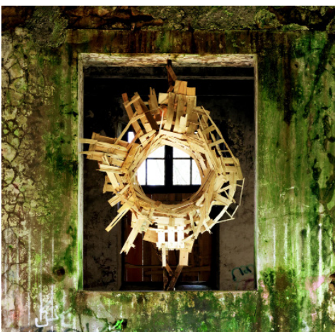
▲ Recherche et création artistique (oeuvre Rénance 11, S. Gautreau)