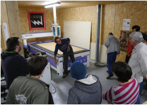
▲ Fablab – laboratoire de prototypage numérique

Les projets de la trentaines de structures installées sur le site foisonnent autour des 4 champs d’actions :