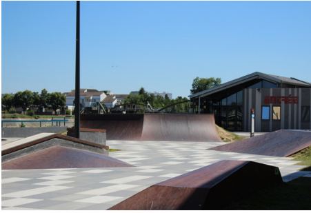
▲ Espace «street»