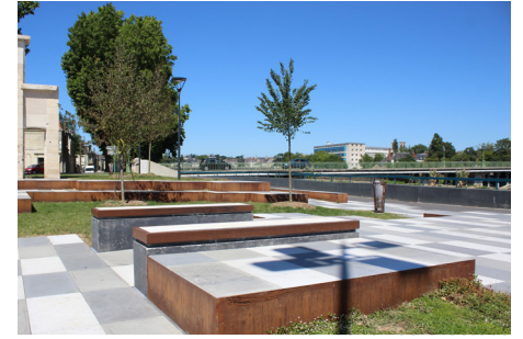
▲ Espace «public»