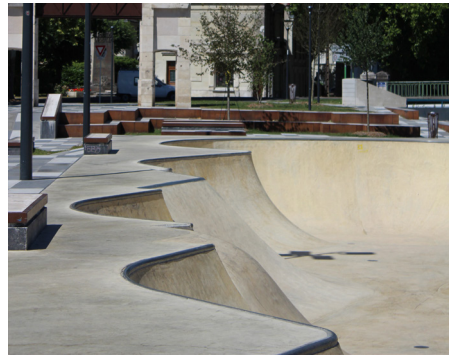
▲ Zone «bowl»