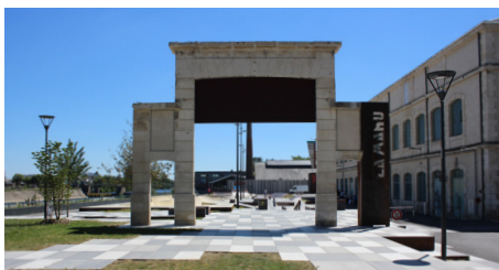
▲ L'ancien porche d'entrée de la Manufacture