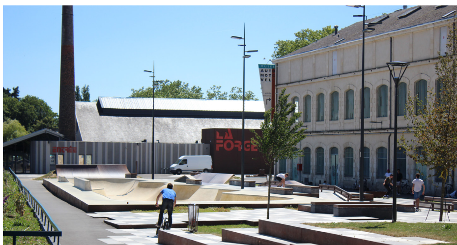
▲ Vue sur les différents équipements du site de la «Manu»