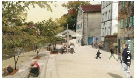
▲ Quai de la Midouze Après : un belvédère