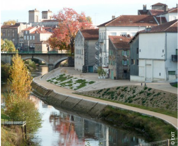
▲ Vue sur l'aménagement adapté aux crues des promenades hautes et basses du quai de la Midouze