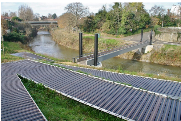
▲ Vue sur la passerelle flottante entre le Quai méchin et le quai Silguy

- Et une en niveau plus haut (du haut de la cale de l'Abreuvoir au Quai Méchin). La promenade haute, dite historique, peut supporter une crue décennale, comme d'ailleurs la totalité des espaces situés en niveau moyen.