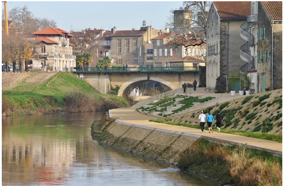
▲ Vue sur la rive gauche et le quai de la Midouze devenu lieu de promenade et de contemplation