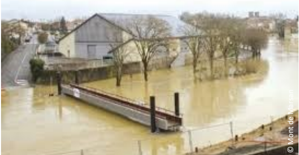
▲ Vue sur la passerelle en période de crue