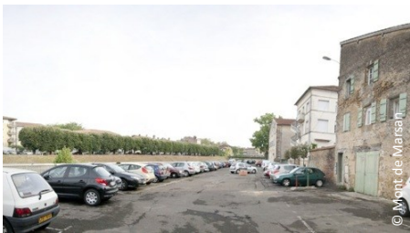
▲ Quai de la Midouze Avant : un parking