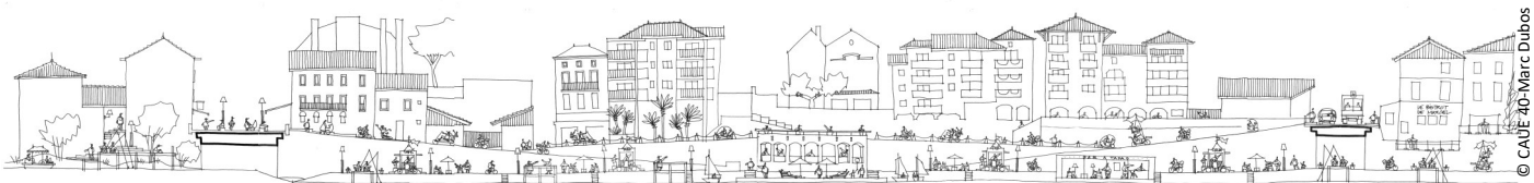
▲ Frise panoramique de la rive gauche depuis la confluence jusqu'au pont des Droits de l'Homme

Après un état des lieux détaillé des 16 km de traversée de la ville par la Douze, le Midou et la Midouze (réalisé par les services municipaux), le CAUE des Landes a conduit une reconnaissance urbaine et paysagère « sensible », élargie aux petits affluents et espaces publics attenants, qui a permis de définir un certain nombre d'éléments de programme du réaménagement des berges.