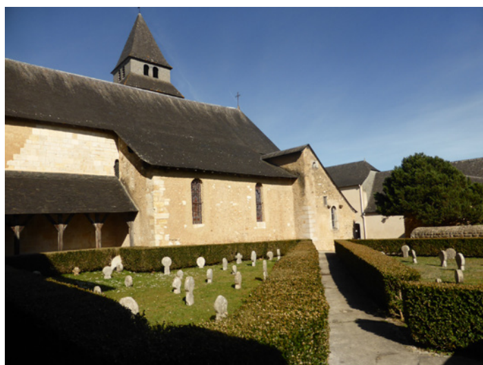
▲ Ses coursives s'ouvrent sur le cimetière dont les stèles discoïdales émergent des pelouses.