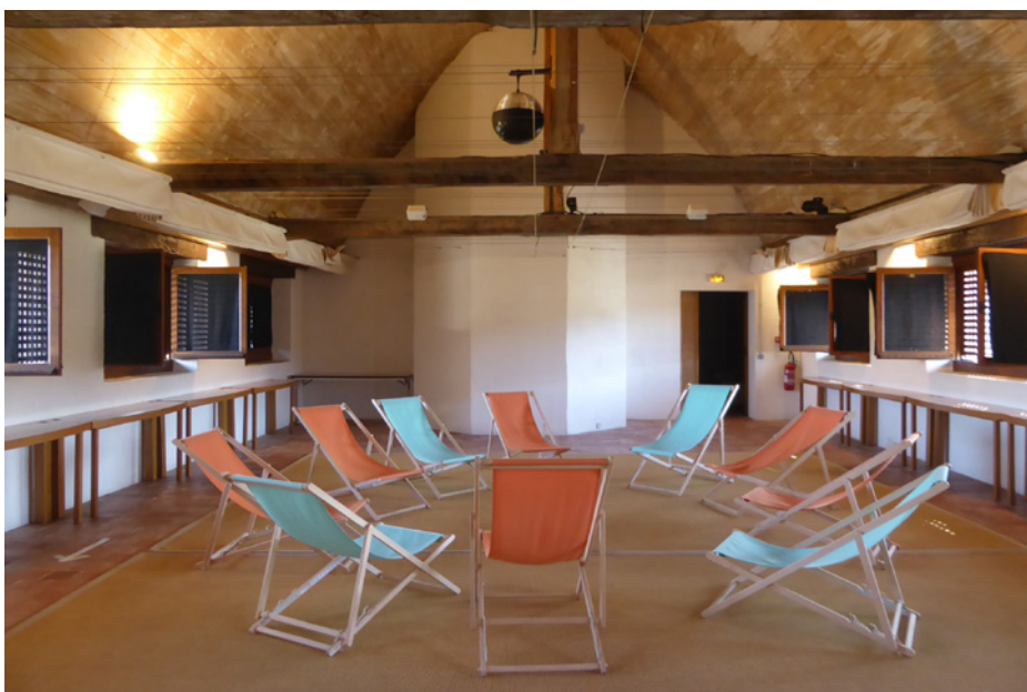
▲ Au dernier étage des transats colorés invitent à la contemplation de la voûte boisée.