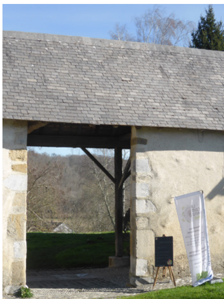
▲ Par ici la visite! La vue file à travers le porche d'entrée vers le paysage des coteaux comme un appel à la découverte.