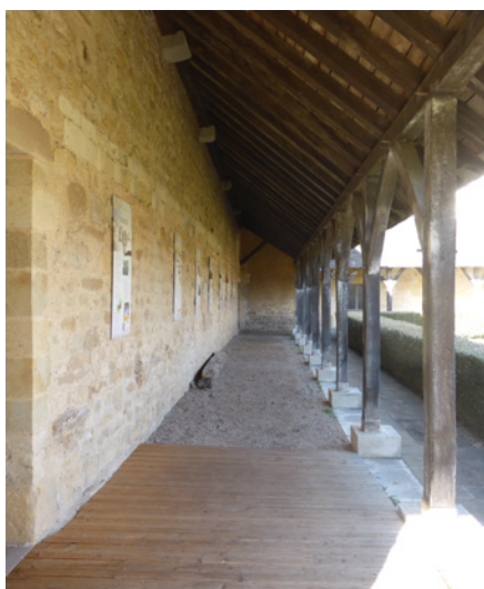
▲ Un cloître suit les flancs de l'église et de la commanderie en proposant une exposition.