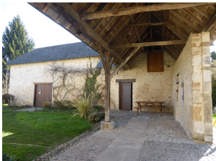
▲ L'accueil des pèlerins se fait toujours dans l'aile Sud. La calade séculaire du porche d'entrée a été foulée par bien des visiteurs...!