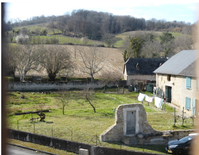
▲ Par les fenêtres du dernier étage, la campagne alentour se révèle dans toute son authenticité, comme si rien n'avait bougé depuis des siècles.