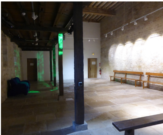
▲ Au rez-de-chaussée la salle de l'ancien hôpital accueille aujourd'hui un spectacle de son et lumière qui retrace l'histoire des lieux ; elle est aussi utilisée régulièrement pour des réunions.