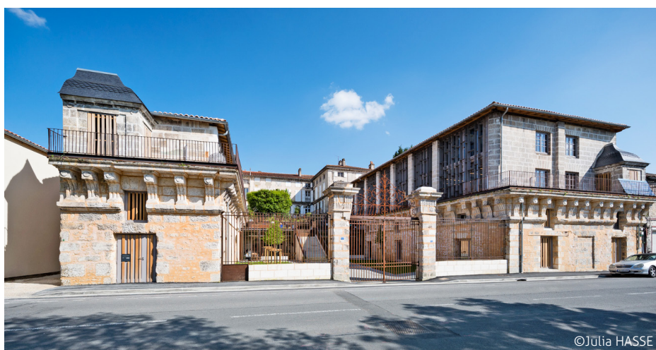
▲ Entrée de l'école 42