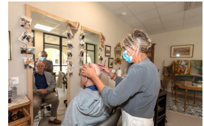
▲ Vue sur le salon de coiffure