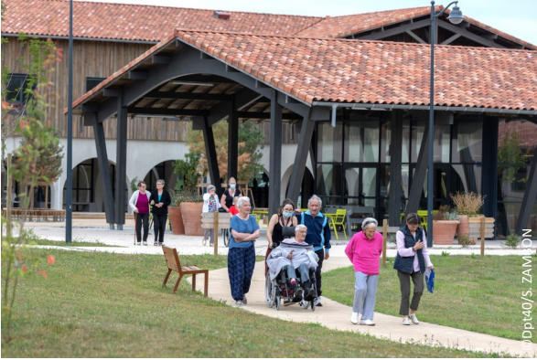
▲ Vue sur le café-restaurant et un chemin de promenade

Le Village en lui-même est composé de quatre quartiers de quatre maisonnées de 300 m 2 , construites dans le style architectural landais (couleur, matériaux, essences locales), qui accueillent chacune entre 7 et 8 résidents. Ces maisons sont composées de parties communes (terrasse, salon, salle à manger et cuisine) ainsi que de parties privatives (chambres équipées de bureaux, fauteuils, d'une télévision et d'une salle de bain).