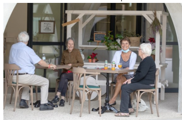
▲ Vue sur la terrasse du café-restaurant