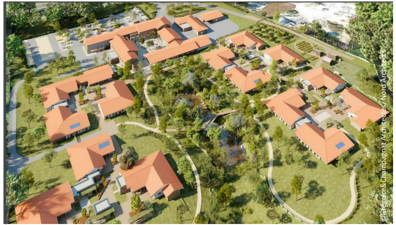
▲ Vue générale du site en plan

L'ensemble du complexe a été construit dans un parc paysagé de 5 hectares permettant aux résidents d'y réaliser balades et séances de sport. Une partie est aussi dédiée à la libre expression des résidents. Ces derniers peuvent y cultiver un potager avec l'aide d'une association locale et s'occuper d'une mini-ferme, regroupant poules, coqs et ânes.