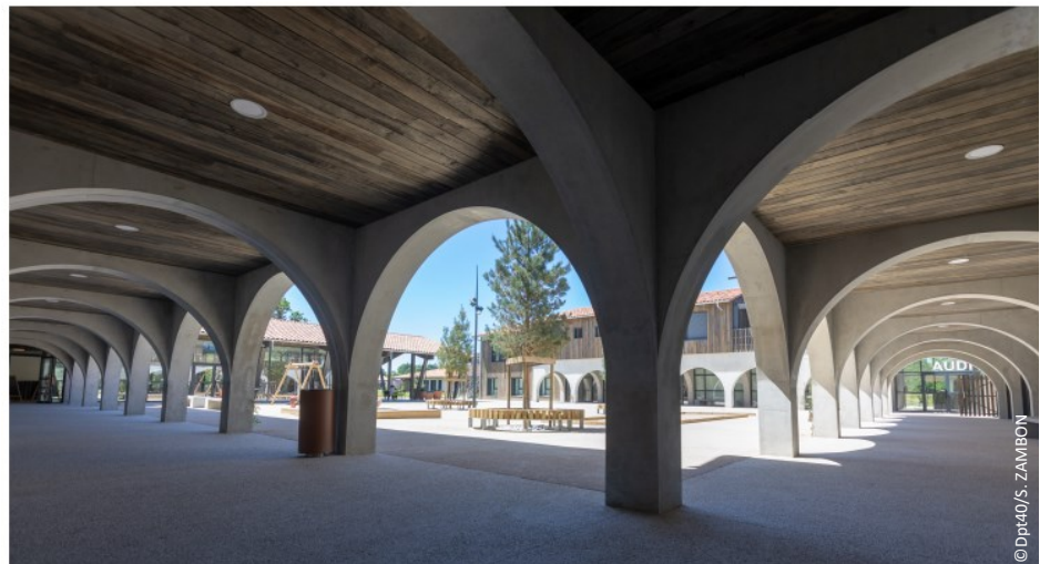
▲ Vue des arcades sur la place de la Bastide

Ouvert en juin 2020, l'établissement accueille 120 habitants, accompagnés de 120 personnels et 120 bénévoles.