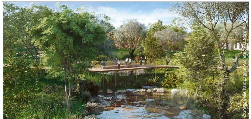
▲ Perspective graphique de la passerelle enjambant l'étang

L'ensemble du complexe a été construit dans un parc paysagé de 5 hectares permettant aux résidents d'y réaliser balades et séances de sport. Une partie est aussi dédiée à la libre expression des résidents. Ces derniers peuvent y cultiver un potager avec l'aide d'une association locale et s'occuper d'une mini-ferme, regroupant poules, coqs et ânes.