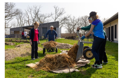
▲ Vue sur l'activité jardinage