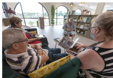
▲ Vue intérieure de la médiathèque

Le Village Landais Alzheimer est le troisième bâtiment en France à obtenir la certification PEFC, et le premier pour un chantier d'une telle envergure. La part bois du Village concerne 14% de la valeur globale de la construction et aura consommé 650 m 3 - exclusivement en pin maritime - provenant des scieries landaises Labadie et Lesbats. La labellisation PEFC du Village a été décernée suite à un audit effectué par QUALISUD, un organisme indépendant.