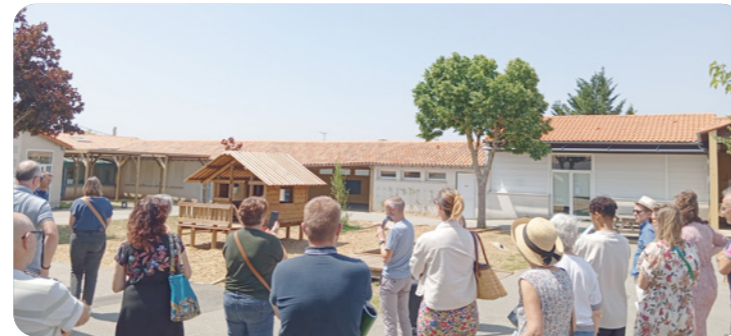
▲ Visite Cour d'école, Cissé