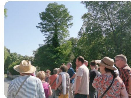
▲ Visite technique, Chauvigny