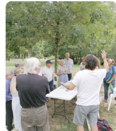
Atelier de concertation, Angles-sur-L'Anglin