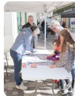
▲ Résidence, Loudun