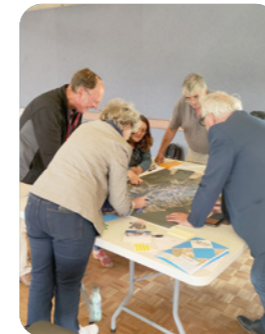
▲ Atelier ZAN, CC Pays Loudunais