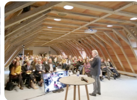
▲ Colloque église cycle « Réinvestir l'existant », Saint-Savin © CAUE86

Conception et rédaction © CAUE86 - mai 2026 - Ne pas jeter sur la voie publique