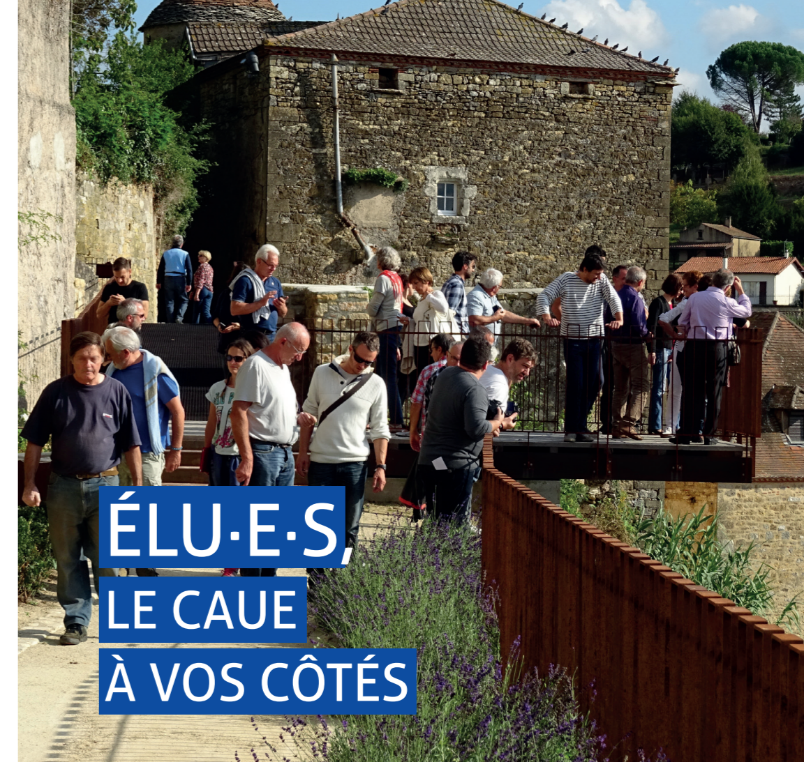
Conception et réalisation : © URCAUE Nouvelle-Aquitaine.